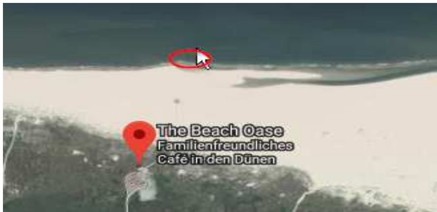
Überwachungsstelle: Strand Oase Quelle www.badehaus-norderney.de

E-mail: Internet: www.norderney.de Internet: www.badehaus-norderney.de/