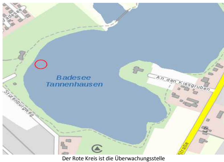
Der Rote Kreis ist die Überwachungsstelle