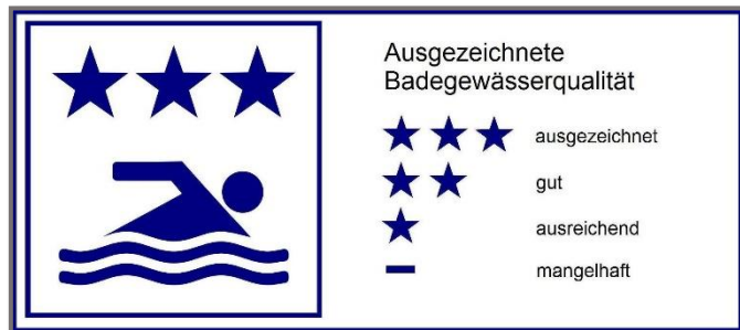
Einstufung gem. EU-Richtlinie 2006/7/EG