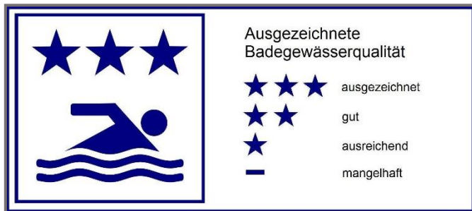
Einstufung gem. EU-Richtlinie 2006/7/EG